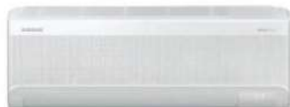
(un. interior compatível com FIM - Multi-Split)